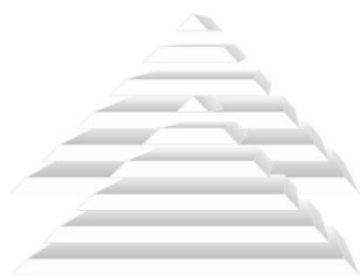
Figura 1 - Exemplo de inserção de uma figura